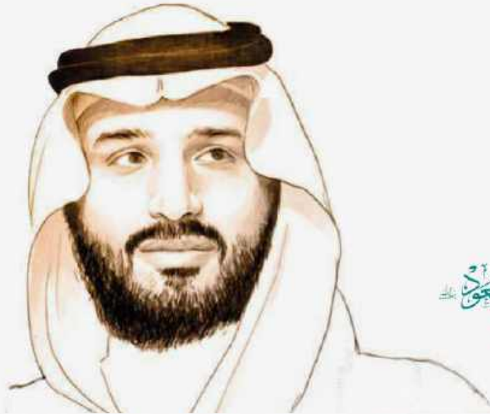
صاحب السمو الملكي الأمير محمد بن سلمان بن عبدالعزيز آل سعود ولي العهد ، رئيس مجلس الوزراء

”سيكون هدفنا أن يحصل كل طفل سعودي على فرص التعليم الجيد وفق خيارات متنوعة، وسيكون تركيزنا أكبر على مراحل التعليم المبكر.“