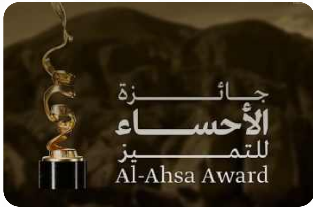
المشاركة في جائزة الأحساء للتميز وجائزة القصيم