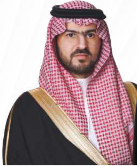
صاحب السمو الملكي الأمير سعود بن عبدالعزيز آل سعود نائب أمير المنطقة الشرقية