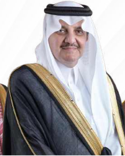
صاحب السمو الملكي الأمير سعود بن نايف بن عبدالعزيز أمير المنطقة الشرقية