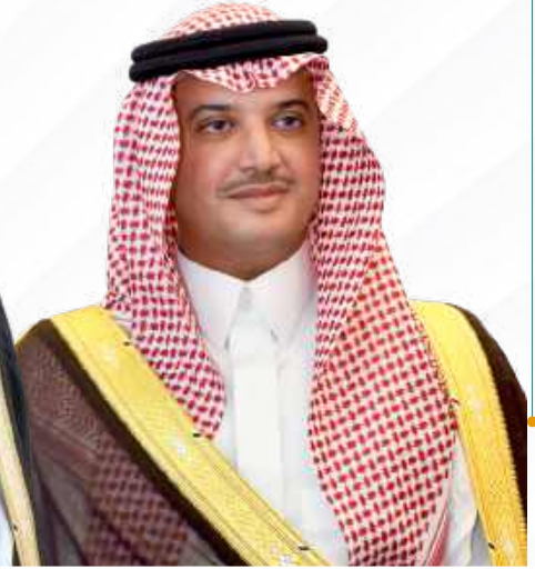
صاحب السمو الملكي الأمير سعود بن طلال آل سعود محافظ الأحساء