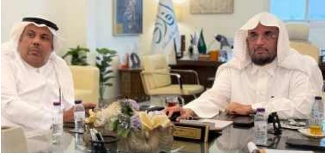
استقبال وفد من هيئة الصحفيين السعوديين بالاحساء