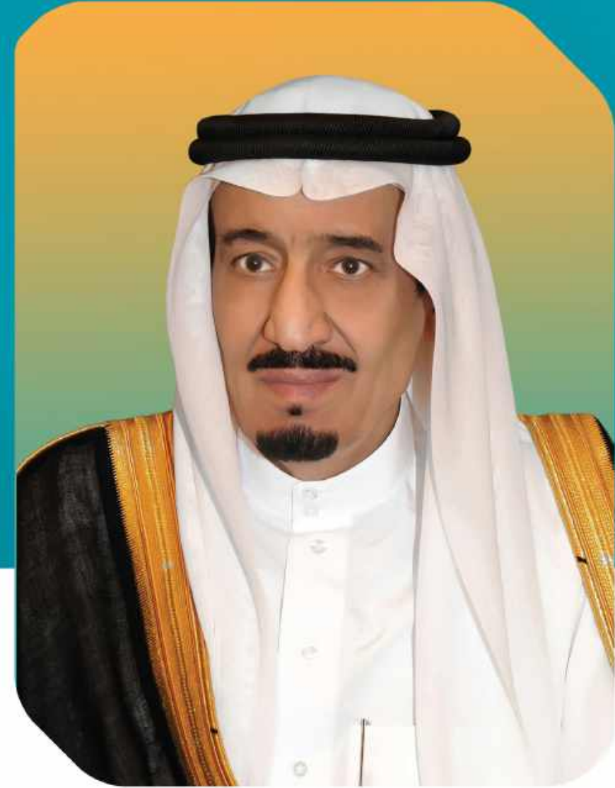
صاحب السمو الملكي الأمير محمد بن سلمان بن عبدالعزيز آل سعود ولي العهد نائب رئيس مجلس الوزراء